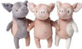
KELGRIS pluszak, świnka, różne wzory 102.980.00