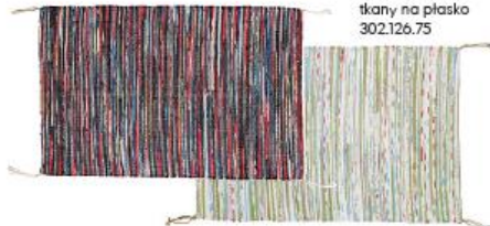
TANUM dywan tkany na płasko 302.126.75