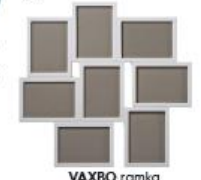
VAXBO ramka na 8 zdjęć 402.566.21