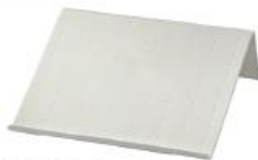
ISBERGET podstawka na tablet 203.025.96