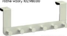
ENUDDEN wieszak na drzwi 602.516.65