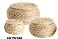
FRYKEN pojemniki 3 szt. 803.281.45