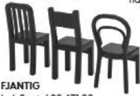
FJANTIG hak 3 szt. 603.471.02